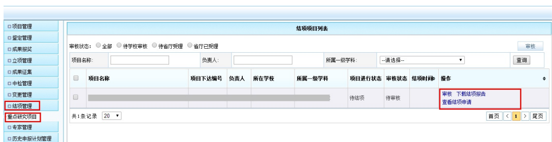
<管理员审核示意图>

管理员登录后，目前只限超级管理员，点击【教育厅业务】à 结项管理，在列表中审核结项信息。高校审核通过的结项申请会被递交到省厅管理员页面。